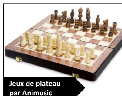
Jeux de plateau par Animusic