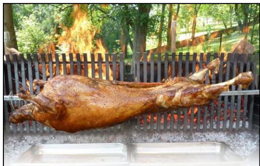
Menu méchoui mouton et pommes de terre