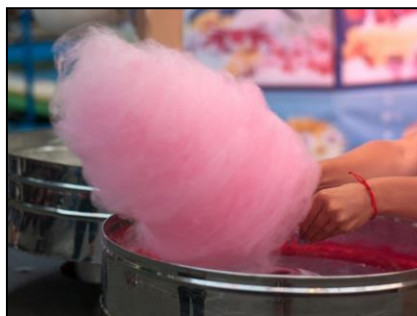
Barbe à Papa