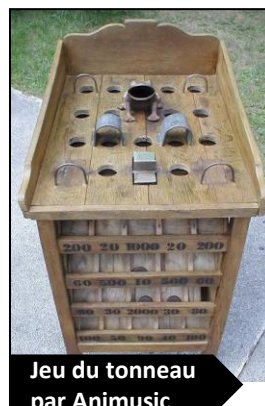
Jeu du tonneau par Animusic