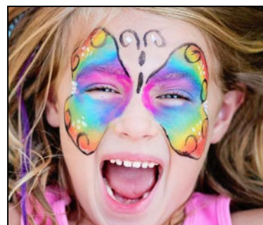
Maquillage par Animusic