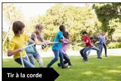
Tir à la corde