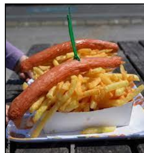
Menu saucisse/merguez frites