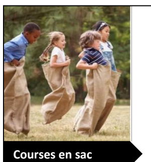
Courses en sac