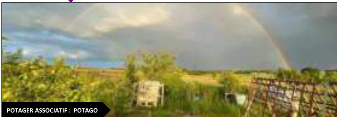
POTAGER ASSOCIATIF : POTAGO

Créée depuis 2016 sur notre commune, l'association POTAGO a pour objectif de cultiver en coopération des légumes, des herbes aromatiques et des petits fruits en privilégiant des techniques de culture respectueuses du sol et de la biodiversité.