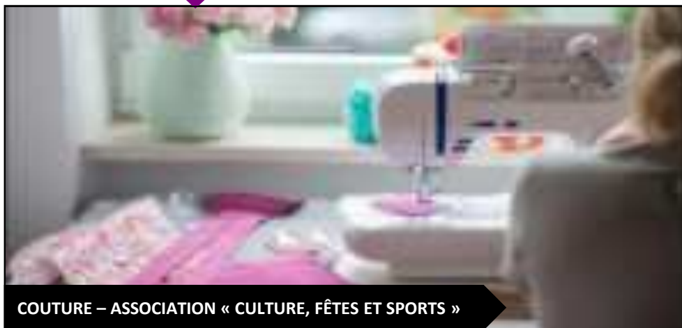
COUTURE – ASSOCIATION « CULTURE, FÊTES ET SPORTS »