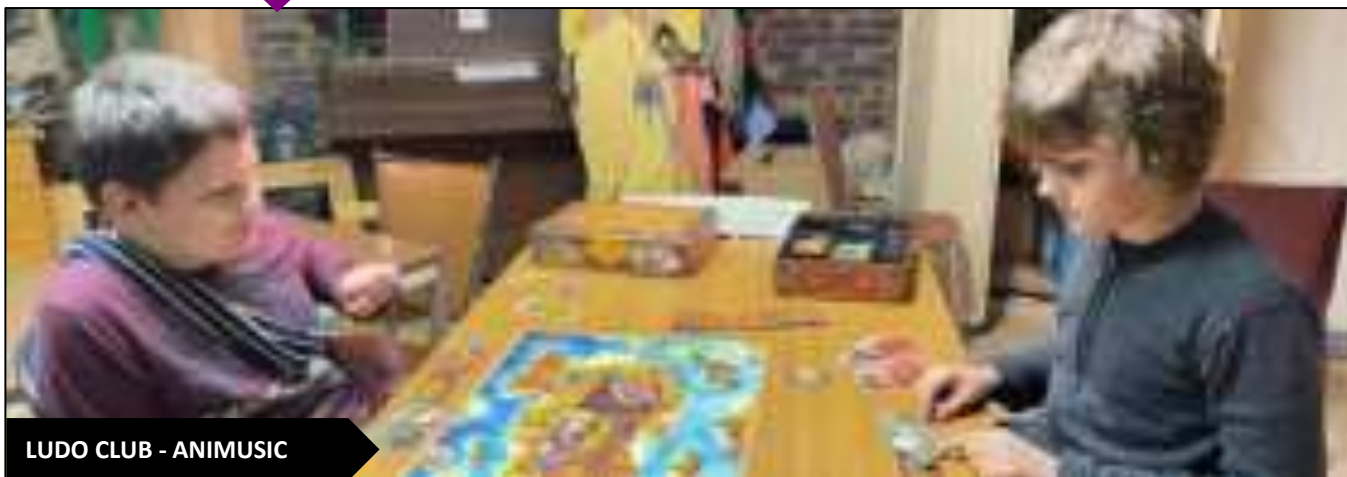
LUDO CLUB - ANIMUSIC

Autour d'une ambiance conviviale, venez découvrir des jeux de société, de rôles, de stratégie, de cartes... depuis le Moyen Âge jusqu'à nos jours.