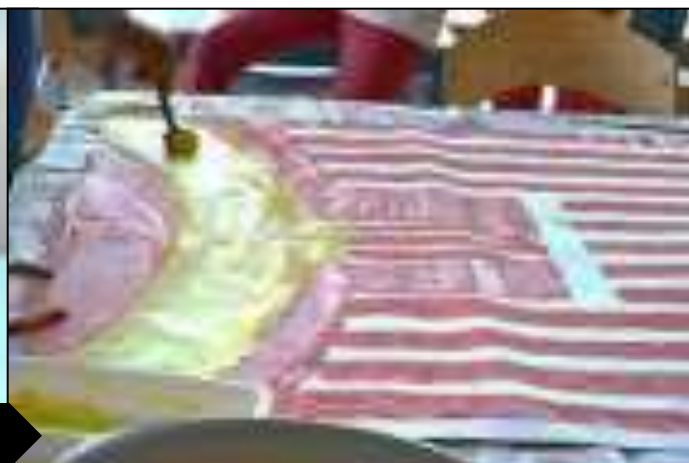
ATELIER BRICOLAGE, DÉCORS ET COSTUMES - ANIMUSIC

Ouvert aux parents d'élèves de théâtre, aux élèves et, par extension, à tous !