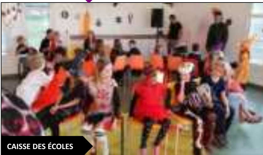
CAISSE DES ÉCOLES