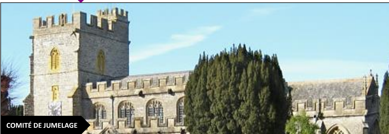
COMITÉ DE JUMELAGE