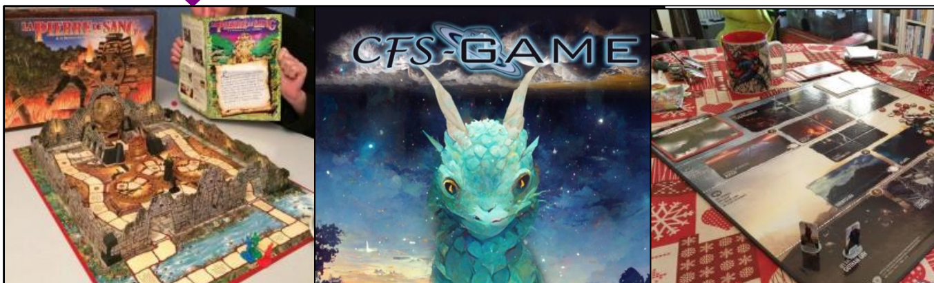
CFS GAME ADULTES ET ADOS (>16 ANS ACCOMPAGNÉ D'UN ADULTE) – ASSOCIATION « CULTURE, FÊTES ET SPORTS »

Autour d'une ambiance conviviale, venez découvrir des jeux de société, de rôles, de stratégie, ou autres jeux de figurines !