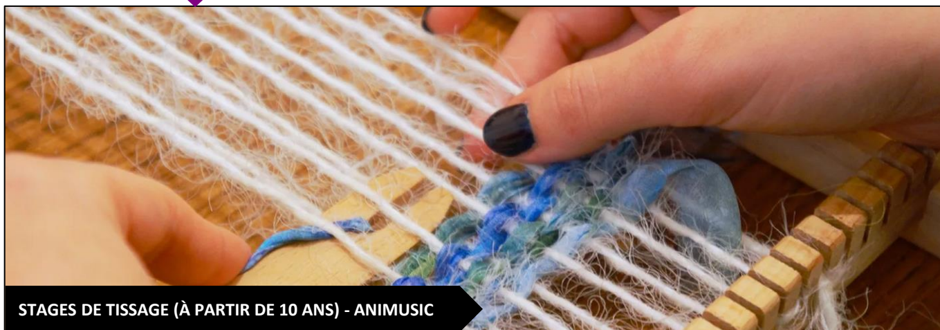
STAGES DE TISSAGE (À PARTIR DE 10 ANS) - ANIMUSIC

Apprenez les techniques de tissage des origines à nos jours et repartez avec votre ouvrage.