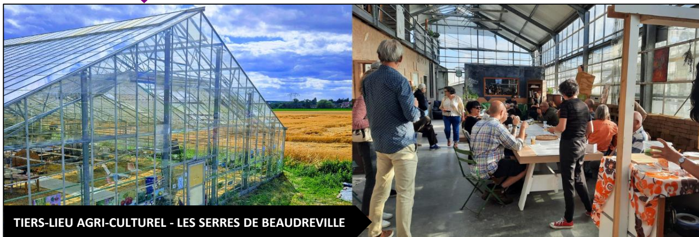
TIERS-LIEU AGRI-CULTUREL - LES SERRES DE BEAUDREVILLE

Créée en 2020, l'association Faire Vivre les Serres de Beaudreville accueille un collectif diversifié de porteurs de projets, principalement issus des mondes agricole, para-agricole, artistique et culturel. La première mission du lieu est de soutenir ces porteurs engagés, de favoriser leur lancement et leur mise en relation avec d'autres acteurs.