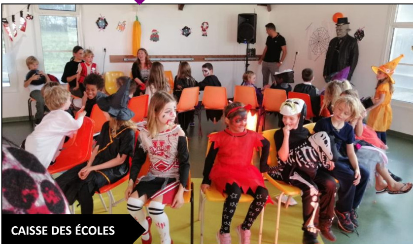
CAISSE DES ÉCOLES