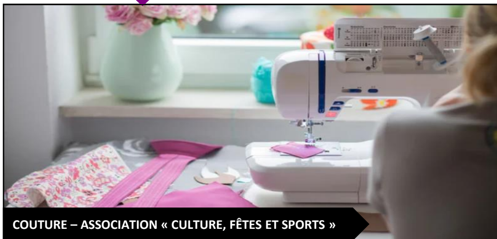
COUTURE – ASSOCIATION « CULTURE, FÊTES ET SPORTS »